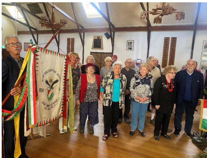
A megemlékezés a Magyar Himnusz eléneklésével végződött