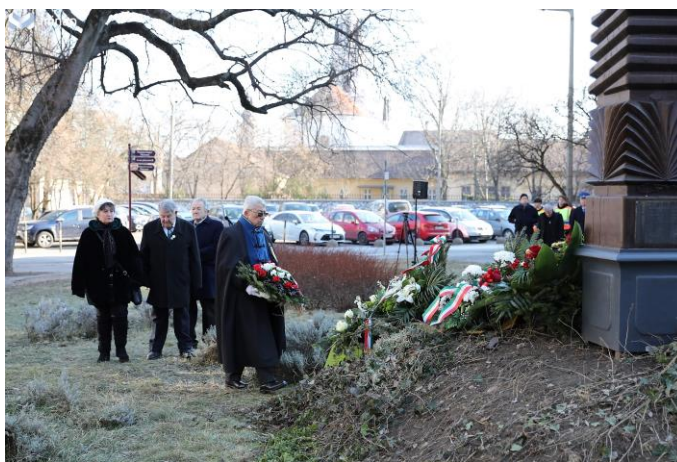
Koszorúz a Doni Szövetség