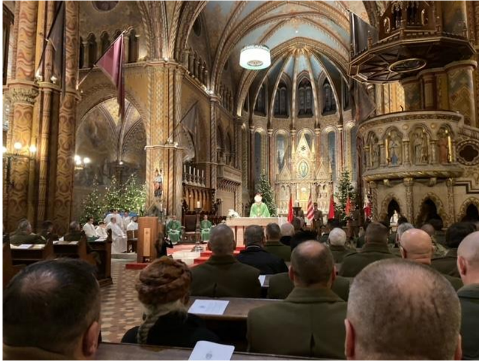
Szentmise a Mátyás templomban

Ugyanakkor kiemelte: bár Magyarország a szövetségesi kötelezettségeinek köszönhetően nem kerülhette el, hogy részt vegyen a Szovjetunió elleni támadásban, a Don-kanyarban harcoló magyar honvédek hősök voltak,