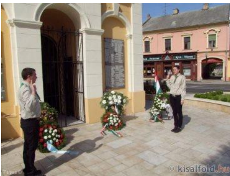
Cserkészek tisztelegnek Mosonmagyaróváron