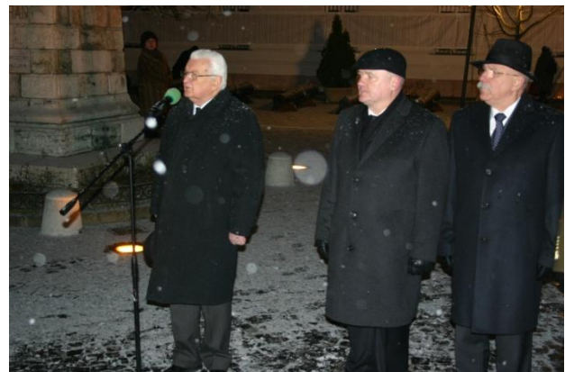
Boross Péter volt miniszterelnök, középen Hende Csaba honvédelmi miniszter.

A teret szinte megtöltötte az emlékezők áradata, közös meghívónk hatására sok fővárosi és vidéki bajtársunkkal is találkozhattunk az összességében igen megható és felemelő ünnepségen.