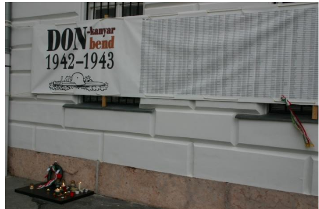
Az elesettek nevét felsoroló ponyva.

halált halt és eltűnt magyarok emléke előtt. Korabeli fegyverek és filmek bemutatása mellett a HIM falára kifeszített száz méter hosszú, széles ponyván olvashatták a látogatók a rudkinói II. Magyar Központi Katonai Temető gránittábláira vésett sok ezernyi hősi halott katona nevét.