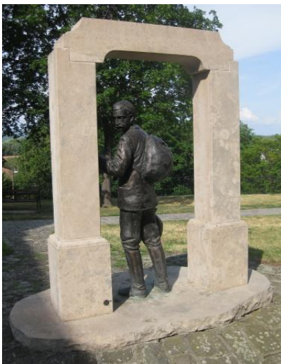
A kitelepítettek megható emlékműve Duna-bogdányban.